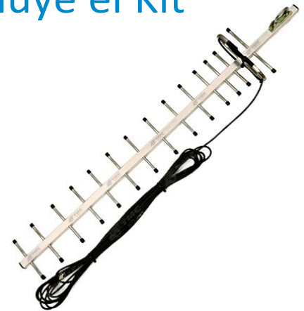
Antena TasKer™ (TM-XPRO17)

* Este modelo de antena, su tamaño puede variar según la zona de acuerdo a los requerimientos*